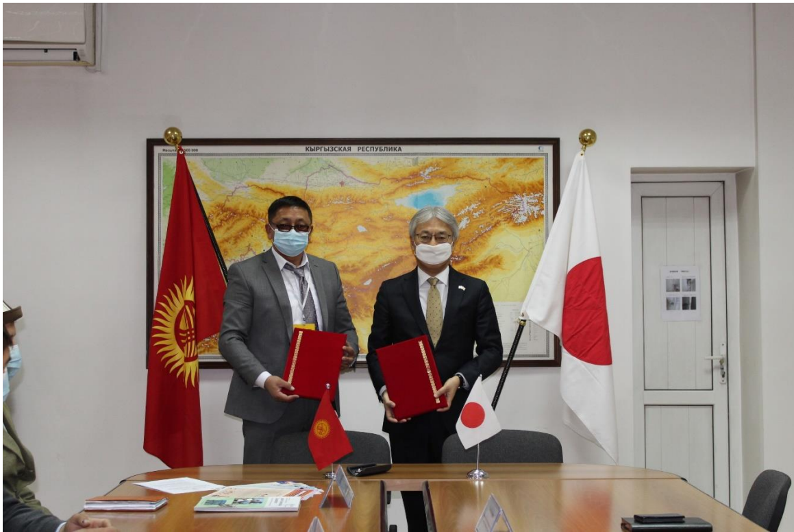
На фото (слева направо): Глава айыл окмоту Тонского айыльного аймака г-н Мамбетов Болотбек и Чрезвычайный и Полномочный Посол Японии в КР г-н Маэда Сигэки